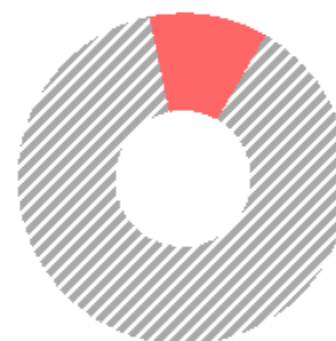
ДИНАМИКА ДОЛИ БРЕНДА НА РЫНКЕ САНКТ-ПЕТЕРБУРГ , ИЮНЬ 2018 Г